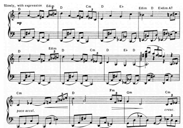
Abbildung 4: Lawrence Thema

Dabei kann man beispielsweise die Britische Armee durch Marschmusik und Piccoloflöte von den arabischen Klängen mit Tamburin, Pauken und zum Teil Oboe abgrenzen. Der Sonnenaufgang wird zum Beispiel sehr bildlich durch eine Aufsteigende Tonfolge ausgedrückt. Kameltraben durch Wechselnoten. Sterne durch Glockenspiele.