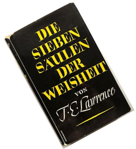
Abbildung 3: Die sieben Säulen der Weisheit

Lawrence hält sich in Selbstüberschätzung für unverwundbar und wird inkognito von türkischen Soldaten festgenommen und misshandelt. Fast gebrochen kehrt er nach Kairo zurück, um seine Entlassung aus dem britischen Militär zu erbitten.