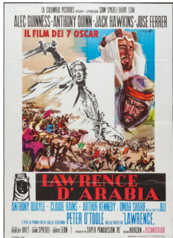
Abbildung 1: Plakat Lawrence d'Arabia

In der deutschen Fassung sind in der restaurierten Fassung tatsächlich immer wieder in einzelnen Abschnitten Wechsel von Sprechern hörbar, da einzelne Teile im Zuge der Restauration in den 80er Jahren nachvertont wurden. 2